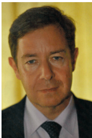
Bernard Schmeltz (Préfet de l'Essonne) :

Q : La rationalisation de la carte intercommunale constitue un des souhaits de la CCI. Où en est la mise en place du Schéma Régional de coopération intercommunale ?